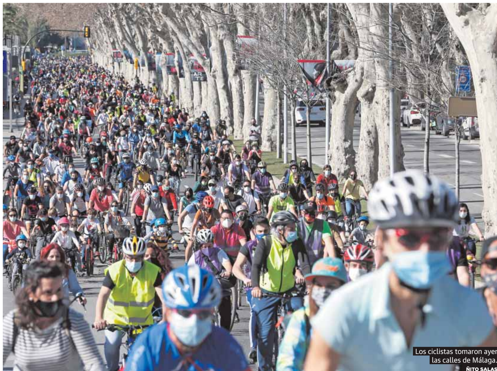
Los ciclistas tomaron ayer las calles de Málaga.

go entre las fuerzas soberanistas. Vox ha pasado de la nada al casi todo; se ha convertido en el referente de la derecha no nacionalista en Cataluña y relegó a la condición de fuerzas casi marginales a Ciudadanos y Partido Popular. Han sido las elecciones catalanas con menos participación de la historia. P22