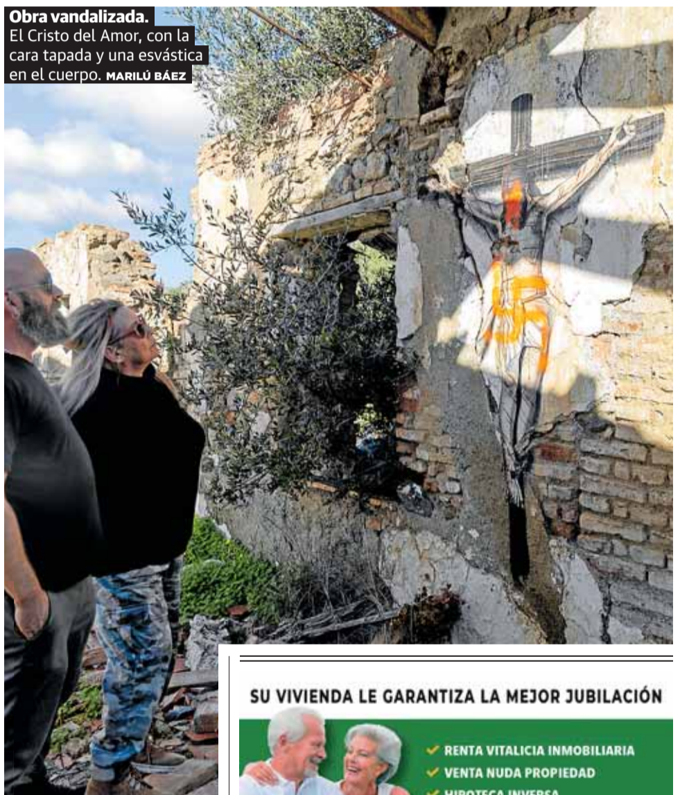
Obra vandalizada. El Cristo del Amor, con la cara tapada y una esvástica en el cuerpo. MARILÚ BÁEZ