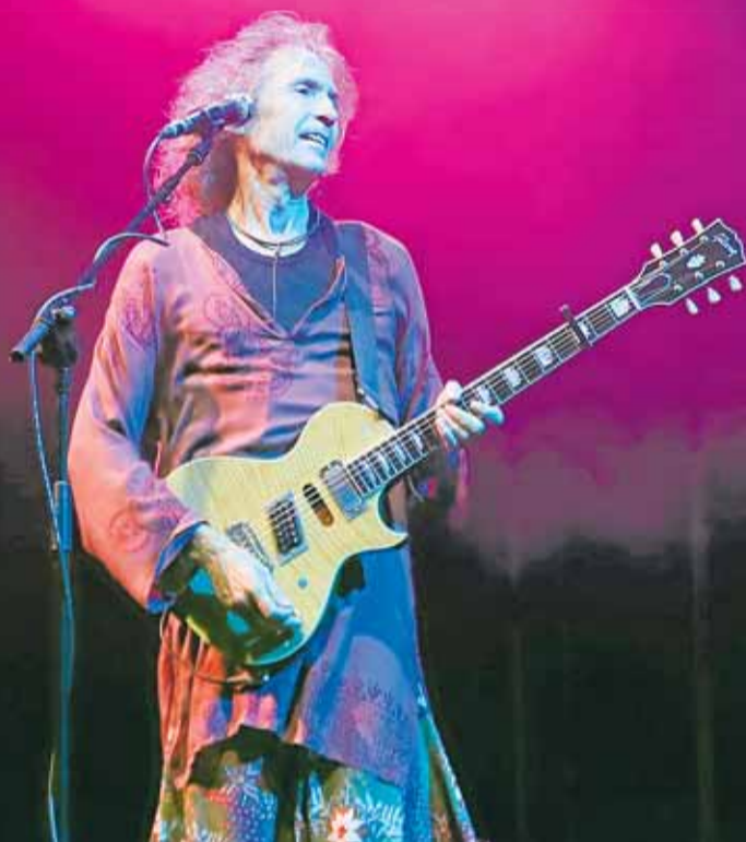
Robe Iniesta, en un concierto de 2024.

El carismático líder de Extremoduro muere de forma repentina a los 63 años P39