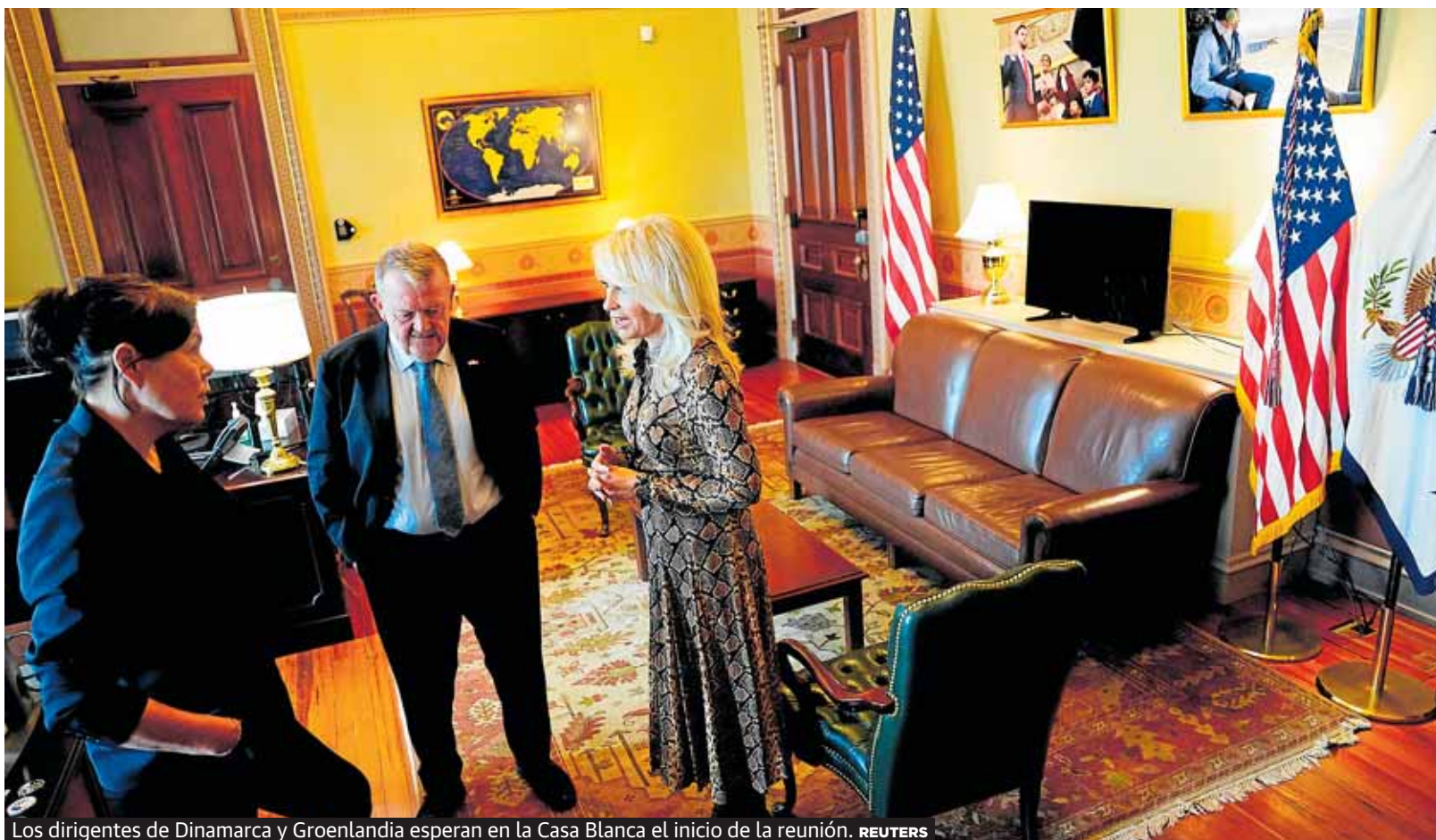
Los dirigentes de Dinamarca y Groenlandia esperan en la Casa Blanca el inicio de la reunión.

Así lo anunció ayer la Autoridad Portuaria en un comunicado «tras diversas conversaciones mantenidas con el Ayuntamiento». P36