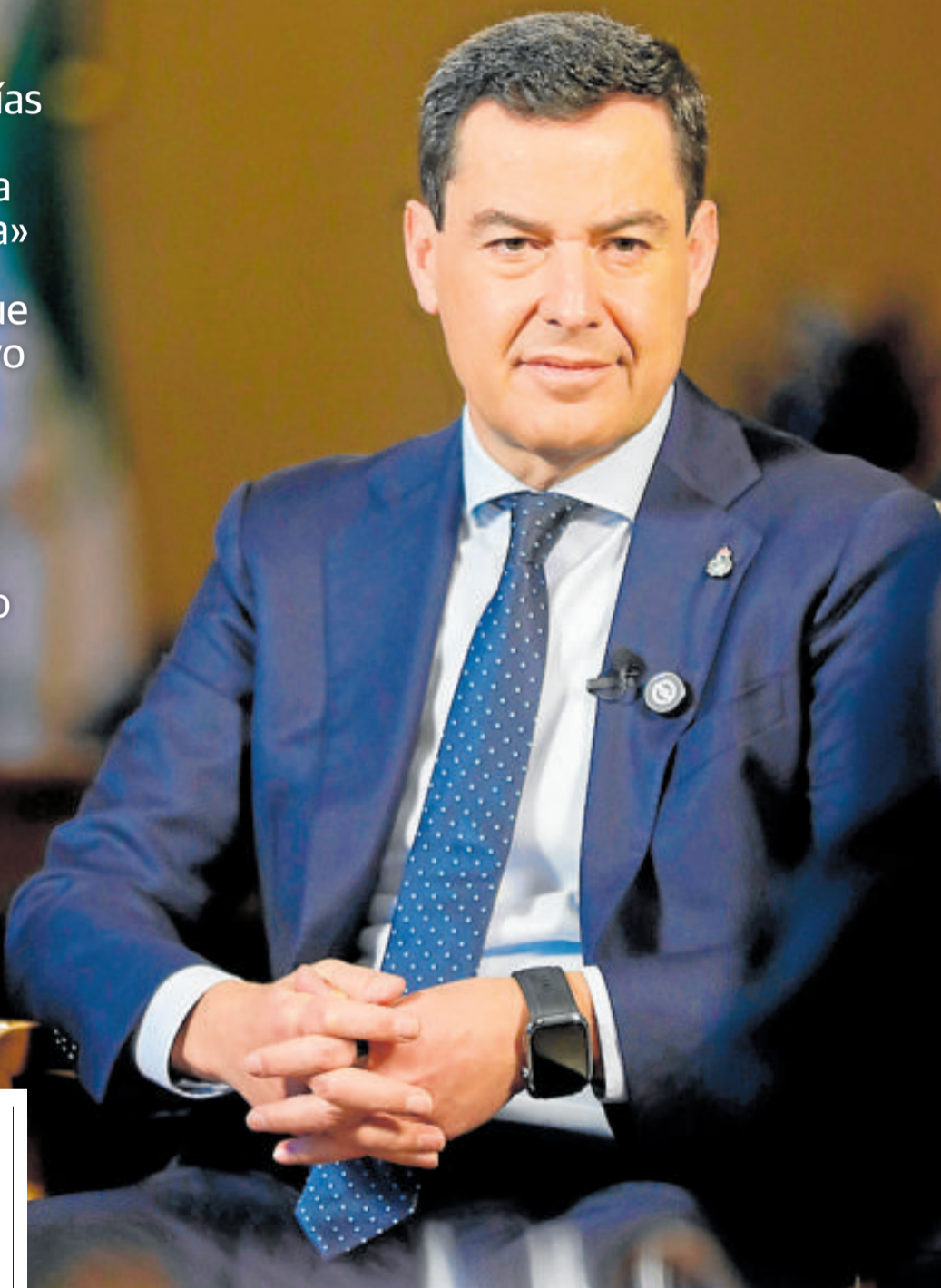
Juanma Moreno posa en San Telmo, sede del Gobierno andaluz.