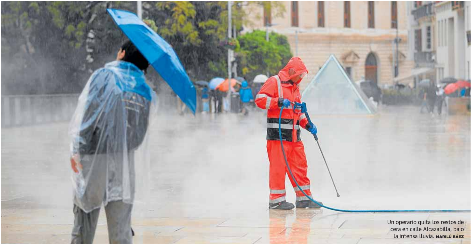
Un operario quita los restos de cera en calle Alcazabilla, bajo la intensa lluvia. MARILÚ BÁEZ